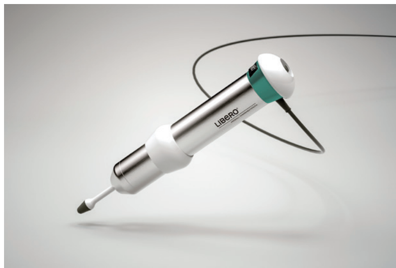
Das Libero®-Massagegerät löst in kürzester Zeit Verspannungen und Blockaden.