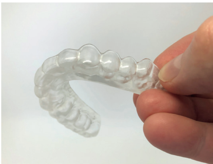
Eine 3-B® Schienentherapie bekämpft die Ursache von Knirschen und Pressen.

Das Therapeutics-Team geht aber noch weiter – besonders was das wirtschaftliche Denken und Handeln angeht. Die Digitalisierung und Industrie 4.0 schaffen Zeit und Ressourcen – auch im Gesundheitsbereich. Deswegen nutzt das Therapiezentrum längst die eigens in der Schweiz