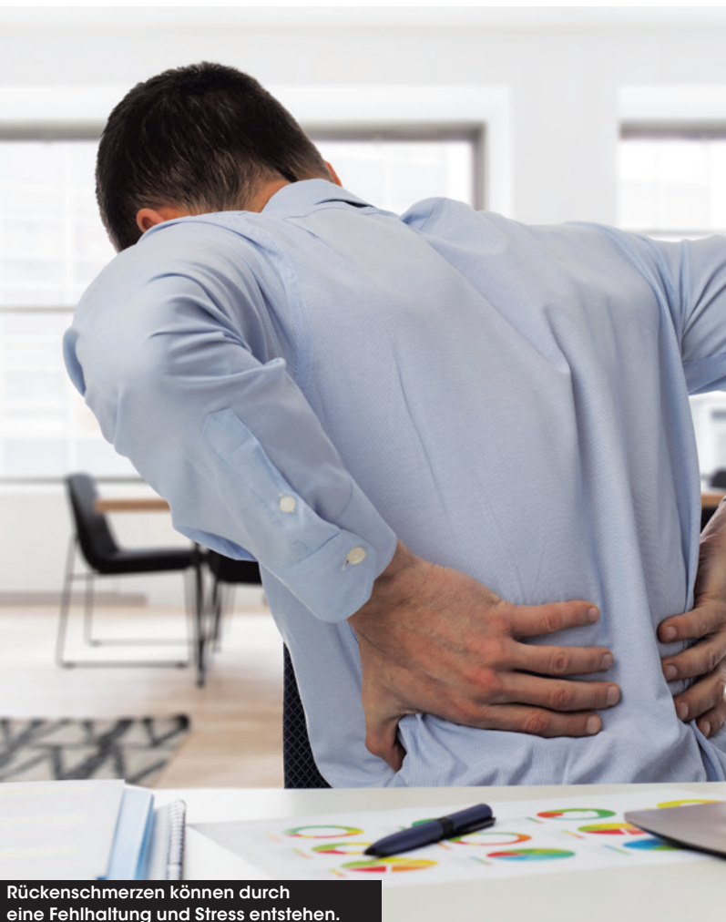
Rückenschmerzen können durch eine Fehlhaltung und Stress entstehen.

Das Therapeutics-Team setzt auf eigenes Wissen und Erfahrungen. Vernetzt mit Spezialisten, Dienstleistern und Lieferanten aus verschiedensten Fachgebieten in der Schul- und Alternativmedizin bilden sie ein interdisziplinäres Netzwerk, das weitreichende, klientenzentrierte und individuell angepasste Therapie- und Arbeitsformen ermöglicht. Orientierung am aktuellen Wissensstand und ständige Weiterbildung ermöglichen eine fortwährende Entwicklung und individuelle Anpassung der Therapieform und Arbeitsmethodik. >